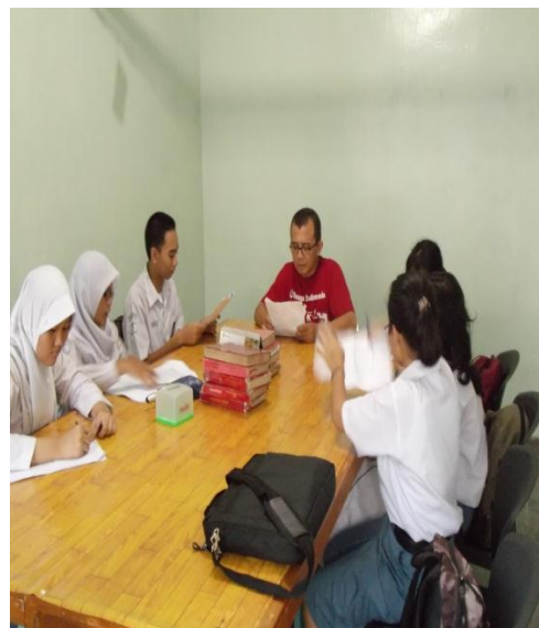
Gambar 5. Mengumpulkan Informasi dari berbagai sumber