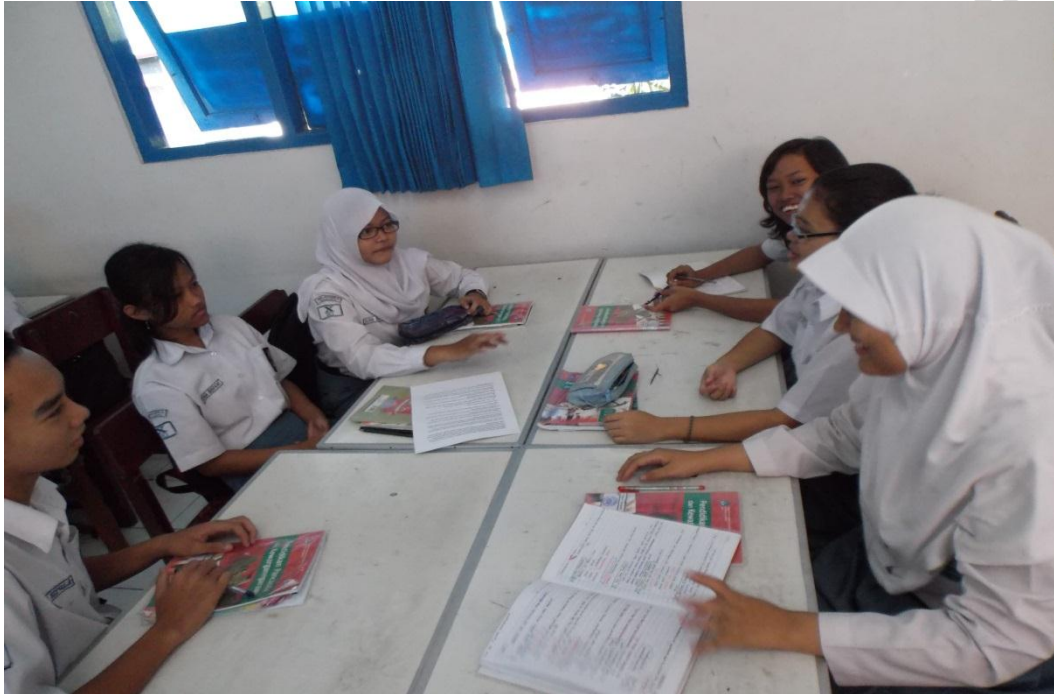
Gambar 6. Mengembangkan Media Poster

Kamu bisa mencari alamat mereka dari buku telepon. Atau kamu dapat menghubungi perguruan tinggi tersebut untuk mendapat bantuan dari para ahli. Kamu boleh juga menghubungi guru-guru SMP atau SMU yang ada di sekitarmu.