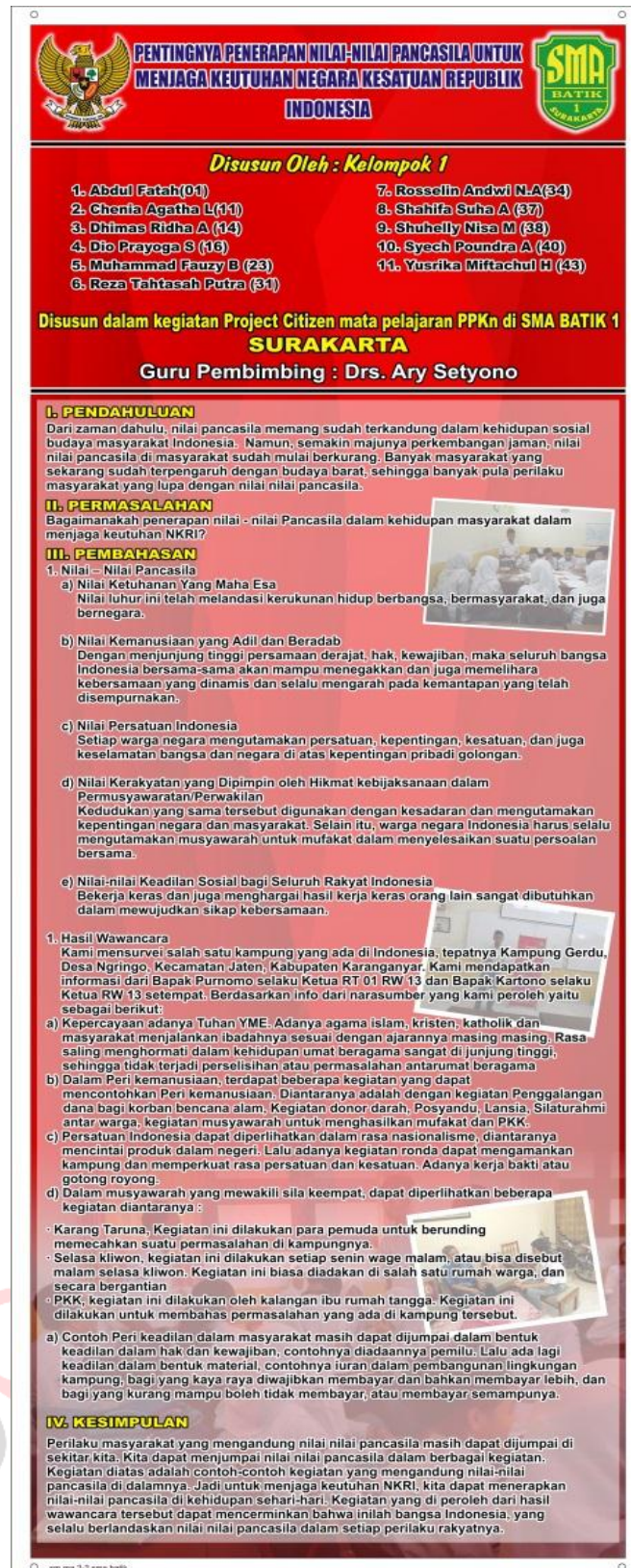
Gambar 9. Poster Kelompok 1