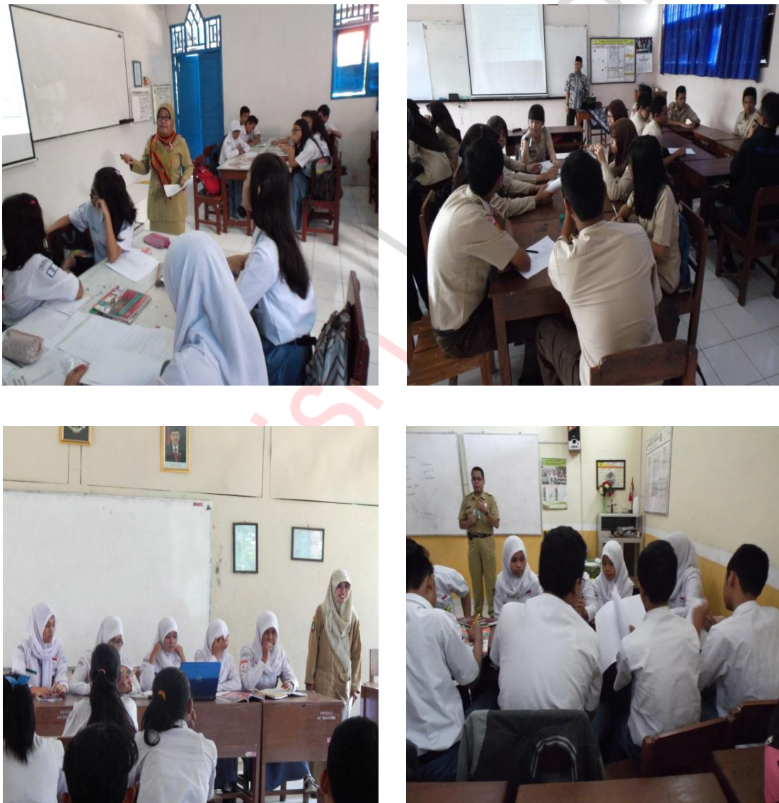
Gambar 2. Proses Identifikasi Masalah

Berikut ini adalah contoh-contoh masalah berkaitan dengan menjaga keutuhan Negara Kesatuan Republik Indonesia: