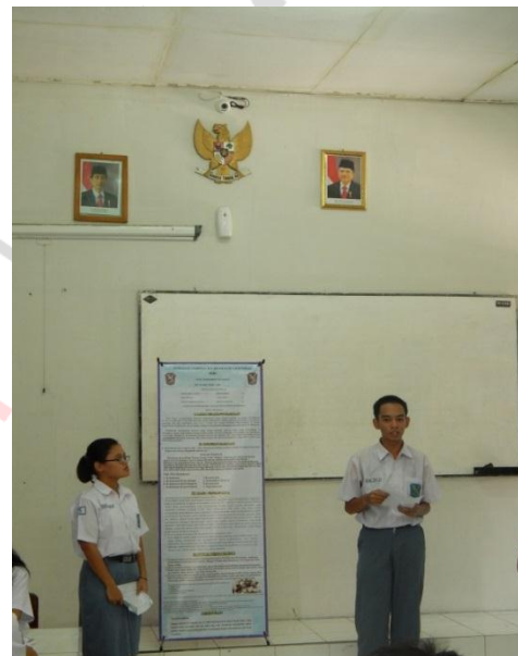
Gambar 7. Menyajikan Poster dalam kelas