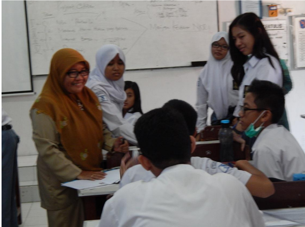
Gambar 4. Pemilihan Masalah untuk dikaji kelas