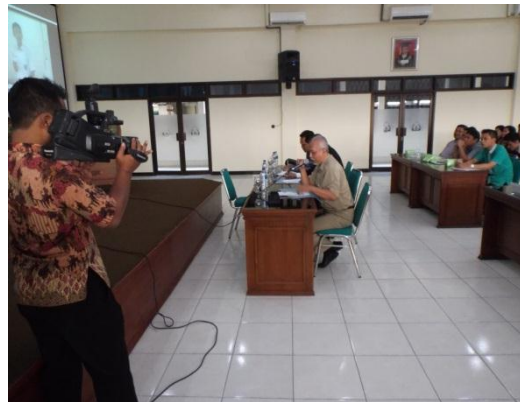
Gambar 13. Keterlibatan Stakeholder