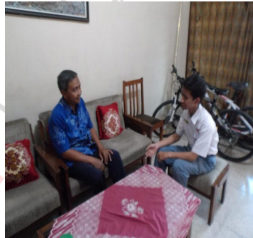
Gambar 3. Telusur data di luar kelas