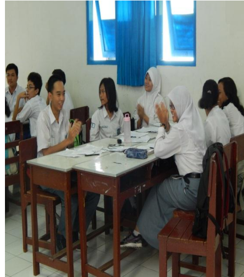
Gambar 8. Refleksi Pembelajaran dalam kelas